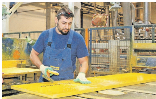
Minimálny vymeriavací základ pre živnostníkov je nadviazaný na priemerné platy.

Kým vlni dostal 2551,87 eura, po novom to bude 2635,68 eura. Ide o základný plat, mestskí poslanci ho môžu zvýšiť až o 70 percent.