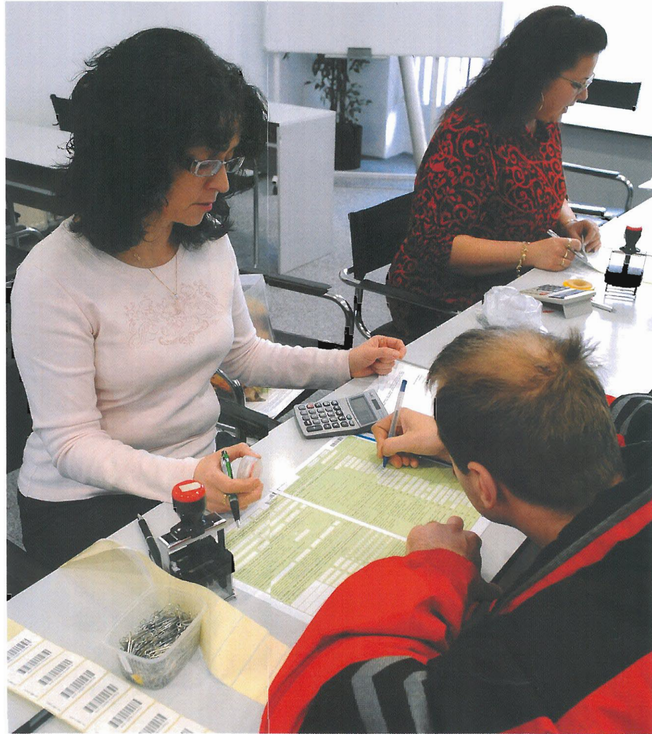
AK SI SVOJE POVINNOSTI PLNIŠTE NAČAS, VYHNETE SA PROBLÉMOM.