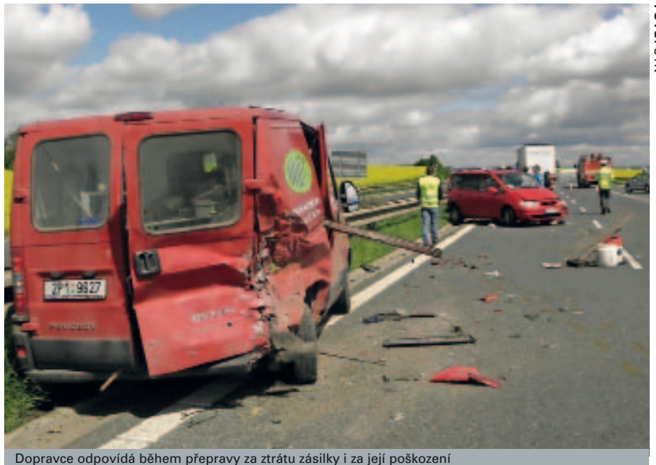
Dopravce odpovídá během přepravy za ztrátu zásilky i za její poškození

Neobsahuje-li nákladní list výhrady dopravce s jejich odůvodněním, platí domněnka, že zásilka a její obal byly v okamžiku převzetí dopravce v řádném stavu a že počet kusů, jejich značky a čísla se shodovaly s údaji v nákladním listu. Prokázání opaku leží pak na dopravci samotném. Dopravci by v této souvislosti měli vzít na vědomí, že české soudy považují nákladní list za jednoznačný důkaz o množství zboží převzatém dopravcem, resp. předaném příjemci, a to,