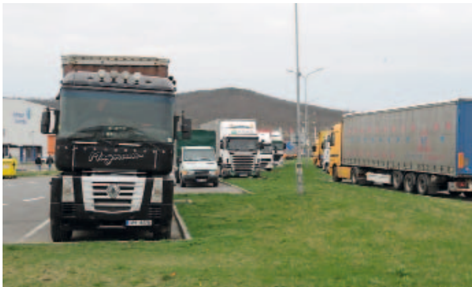
Dopravce by neměl nechat zboží v kamionu nestřežené. V případě krádeže by mu to u soudu značně přitížilo

nucena dodržovat evropské předpisy o minimálních přestávkách v jízdě, nýbrž i výběr trasy a volbu časového rozvrhu v případě, že sjednaná doba dodání nebyla dopravcem dodržena. Dlužno dodat, že české soudy se k tomuto výkladu začínají rovněž přiklánět.