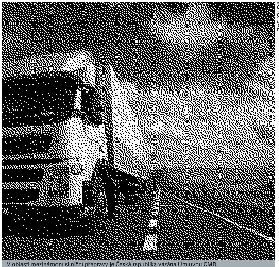
V oblasti mezinárodní silniční přepravy je Česká republika vázána Úmluvou CMR

Výše uvedené limity se neuplatní, jestliže došlo k jednání, které by bylo kvalifikováno podle čl. 29 Úmluvy jako úmyslné nebo jako jednání realizované způsobem rovnocenným úmyslu. Dopravce bude v takovém případě povinen uhradit celkovou vzniklou škodu, která v tomto případě může zahrnovat i úhradu dovozného, cla a jiných výloh vzniklých v souvislosti s přepravou zásilky,